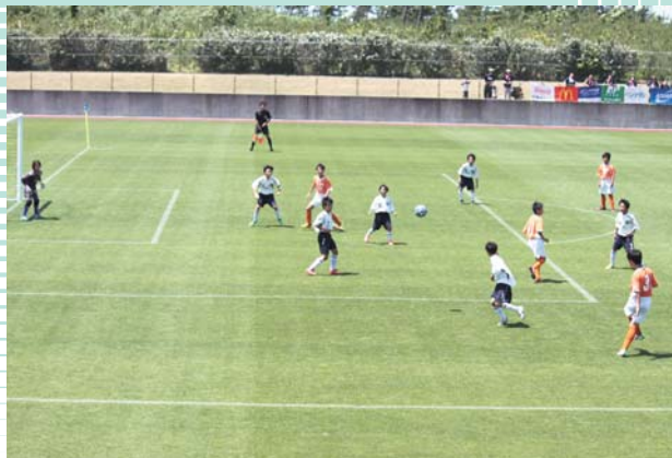
6/29 西目カントリーパーク